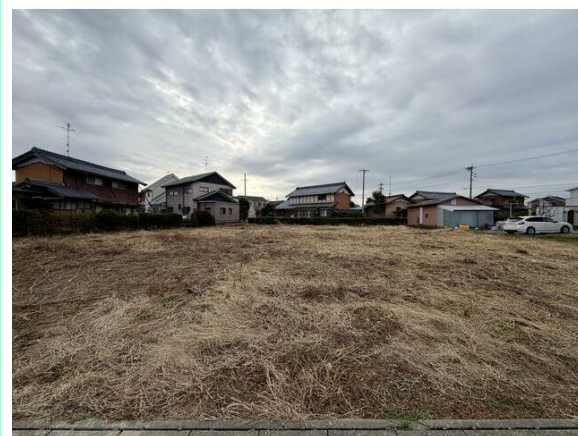
中央小学校まで徒歩6分の立地です☆