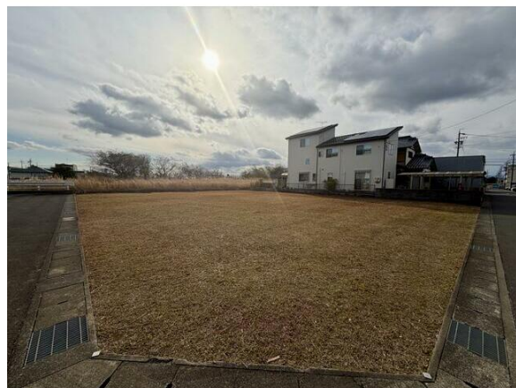
交通量の少ない静かな住環境☆