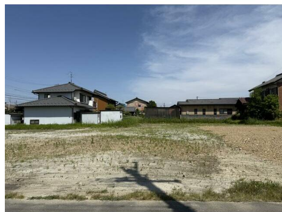
敷地面積約60坪の整形地！愛知県にアクセスしやすい立地です！