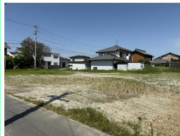
上水道引込工事完了後にお引渡し！