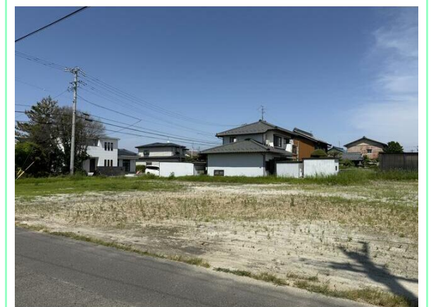
建築条件なしのため、お好きなハウスメーカーで建築可能です！

※この図面はATBBの物件情報の一部を抜粋して掲載しております。(現況優先) ※入居日・引渡日変更や付帯条件、別途料金が発生する場合がありますのでご確認ください。