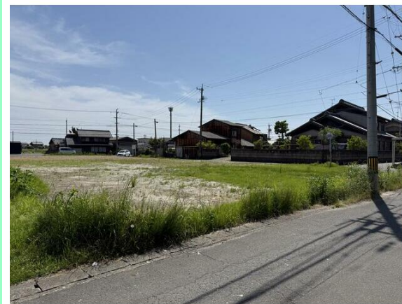
交通量少ない前面道路です！