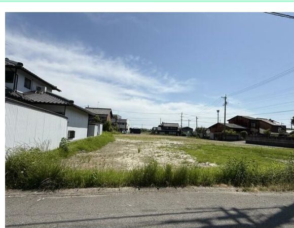
敷地面積約60坪の整形地！愛知県にアクセスしやすい立地です！