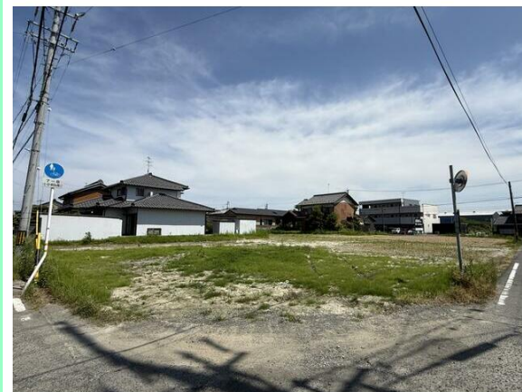
全3区画の分譲地です！