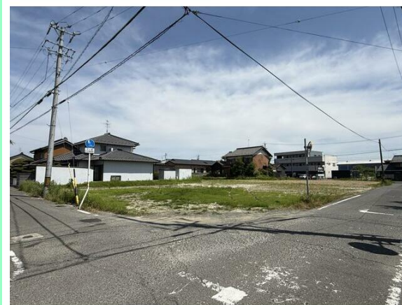
角地！交通量少ない前面道路です！