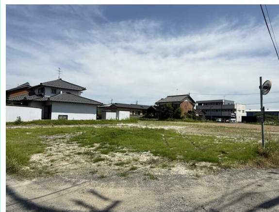
全3区画の分譲地です！